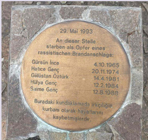
Gedenkstein auf der Unteren Wernerstraße in Solingen